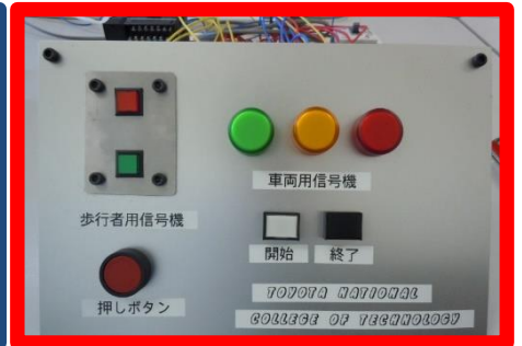
しんごうき 信号機のコントロール

低融点合金の鑄造、金属の電子顕微鏡観察、信号機のコントロールを実際に体験し、ものづくりの楽しさや機械工学の魅力を体感します。