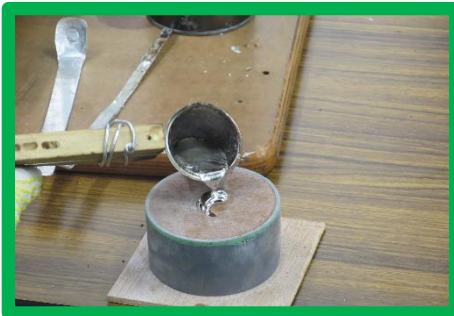
ていゆうてんどうきん ちゅうどう 低融点合金の鑄造