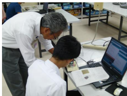
講師によるアドバイス