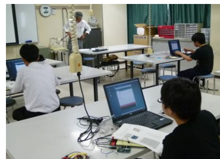
プログラミング風景2