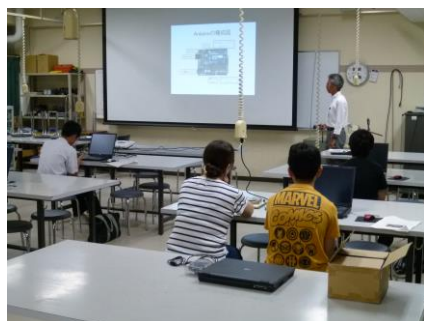
講座風景（概要説明）

受講生はプログラミングや電子回路の組立を通じて、電子工作への興味を持ったようでした。専門的な内容もあって難しい部分もありましたが、普段なかなかできない体験であったため、真剣な表情で先生の話聞いて作業に取り組んでいました。