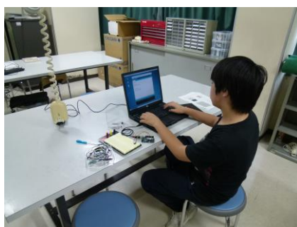
プログラミング風景1