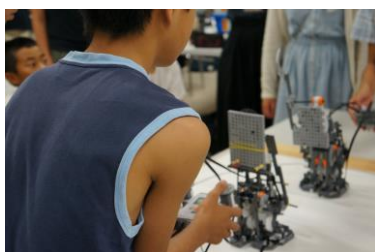
試合開始前の緊張感！