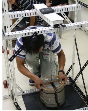
ブリッジコンテスト