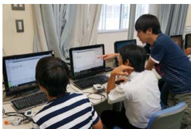
コンピュータプログラムも 優しく教えてもらえます