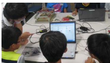
プログラムの作成